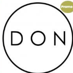
Don Association + Badge de calandre premium 40,00€ 50,00€