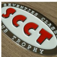
Badge de calandre métal émaillé premium 30,00€